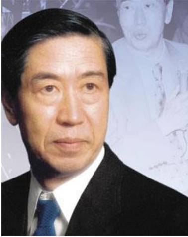
Abbildung 4-9 G.Taguchi

Der Name Taguchi ist für Insider weltweit mit der „Verlustfunktion nach Taguchi“ verbunden.