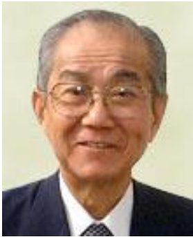
Abbildung 4-10 Y.Akao

Mit der „Quality Function Deployment“ hat Yoji Akao eine Methode für den systematischen Entwurf von Produkten vorgestellt und in die Welt getragen.